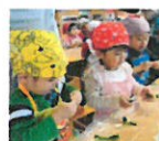
ぱんだ組さんも ピーマンちぎり

園庭で育てたじゃが芋を収穫しぱんだ組、ノア組、ぞう組さんでカレークッキングをしました。みんなで作ったカレーは最高~! とてもおいしかったです!