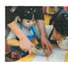
うさぎ組さん初めての 包丁も上手に使えました