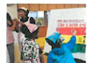
さすが! きりん組さん 栄養クイズ全問正解!