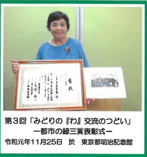
第3回「みどりの『わ』交流のつどい」 一都市の緑三賞表彰式 令和元年11月25日 於 東京都明治記念館

*アジア ミャンマー 井戸建設 7基目達成しました! *保護者、地域の方の ご協力ありがとうございます ございました。