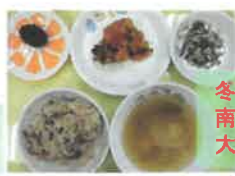
冬至ジュシー 南瓜のいとこ煮 大根のゆず和え