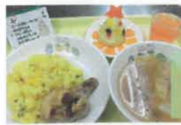
バターライス グリルチキン ツリーポテト