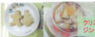
クリスマスポンチ ジンジャークッキー